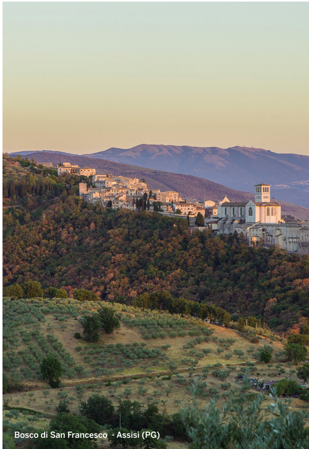
Bosco di San Francesco - Assisi (PG)