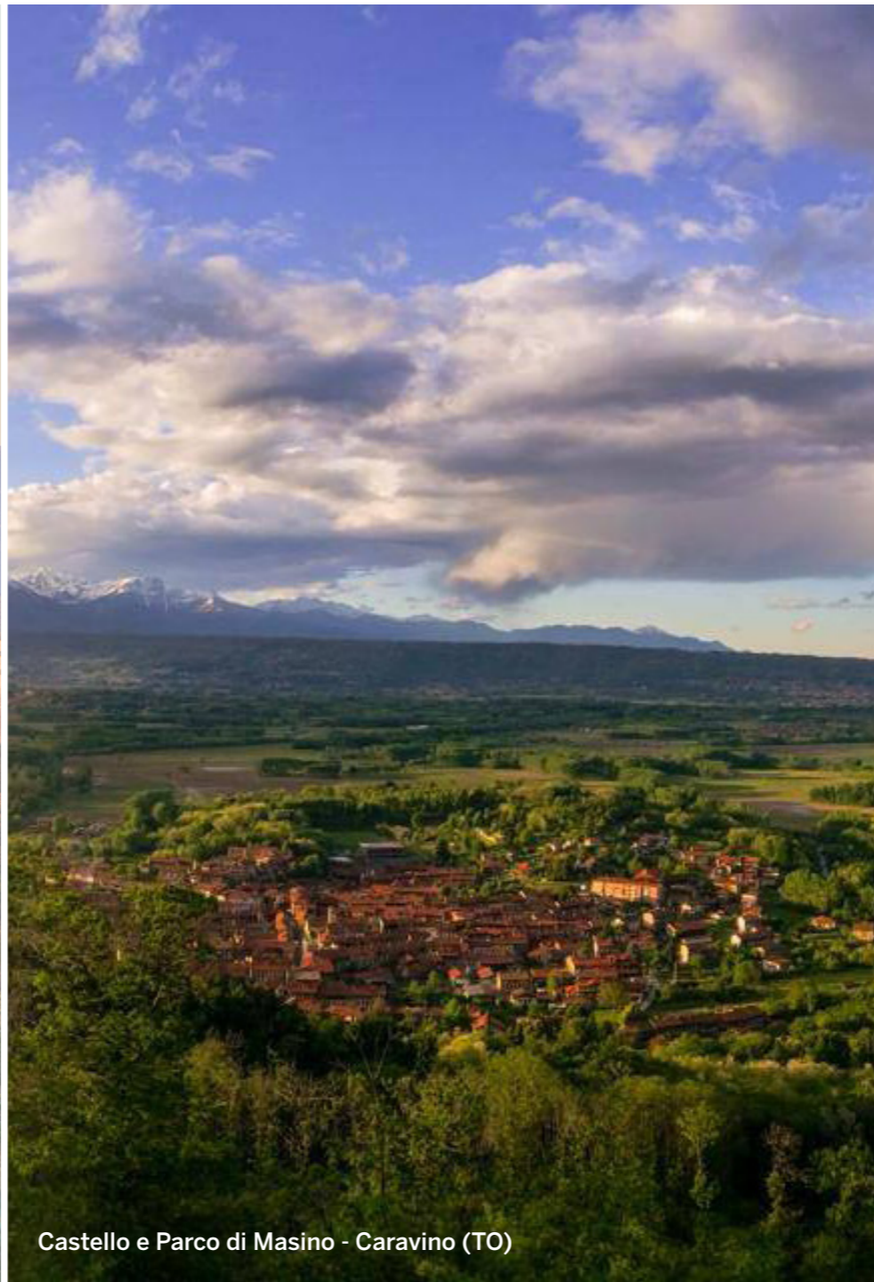
Castello e Parco di Masino - Caravino (TO)